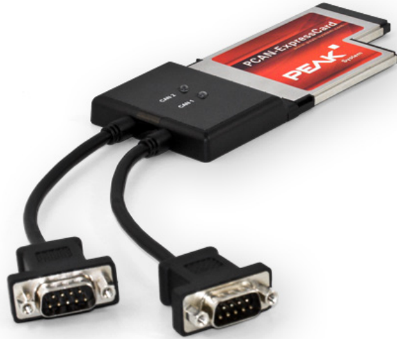
9-pole 커넥터 (male 핀 할당):

이 패키지는 윈도우용 CAN 모니터 PCAN-View 와 프로그래밍 인터페이스 PCAN-Basic 이 같이 제공됩니다.